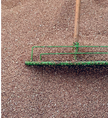
Weizenkörner für gutes Mehl – vor dem Liefern an die Ferrenmühle.