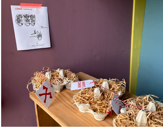
Armin's Zünder: Ein tolles Weihnachtsgeschenk für alle, die gerne an einem...