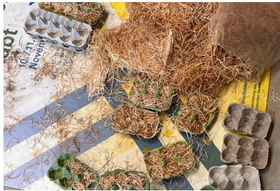
... warmen Feuer sitzen. Einblick in die Zünder-Werkstatt.