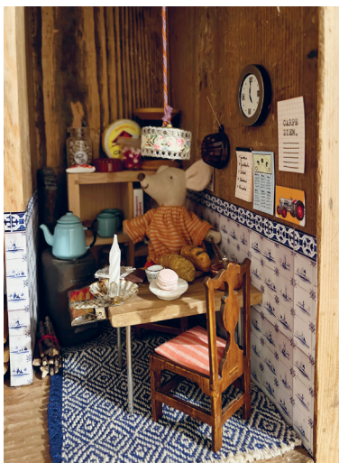
Unsere neuen Untermieter im Hofladen: Familie Maus! Was sie so alles erleben und wie sie sich auf Weihnachten freuen könnt ihr ab sofort mitverfolgen... aber psssst!