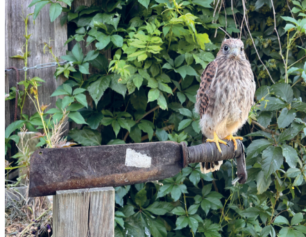
Unsere Turmfalken sind sehr gwundrig :-)