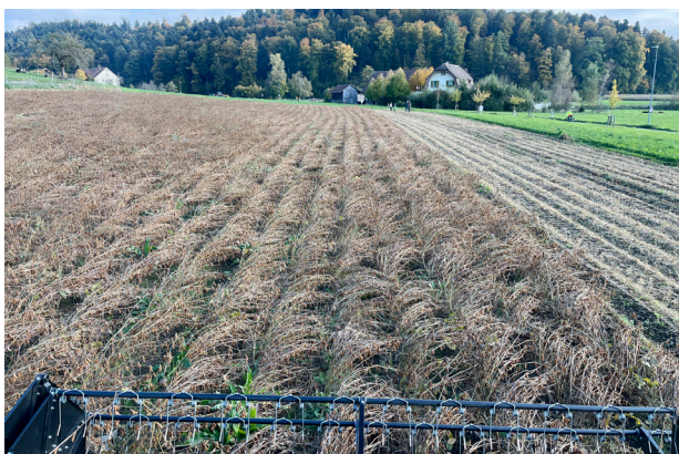
Direkt aus dem Drescher: Blick auf den reifen Soja!