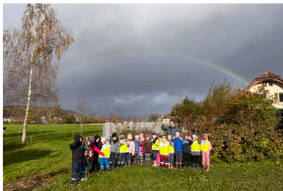
Schüler:innen nach dem Säen.