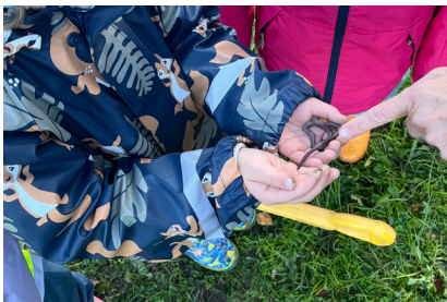
«Viele viele Regenwürmer gross und klein – mögen gute Helferlein in unserem Weizenfeld sein!»