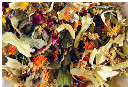
Getrocknet mit Solarstrom: Teekräuter